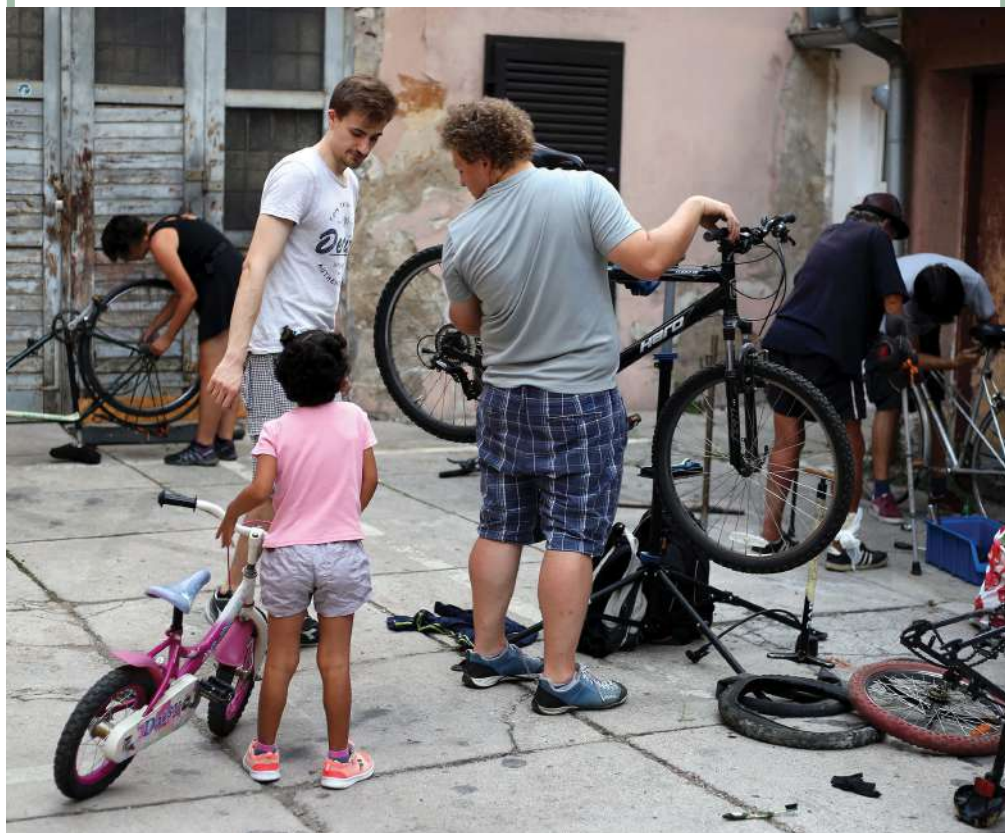
Δωρεάν εργαστήριο επισκευής ποδηλάτων, Ζάγκρεμπ, Κροατία

Πραγματοποιούνται πιθανώς αρκετές εκατοντάδες τέτοια εργαστήρια στην Ευρώπη από πληθώρα επίσημων και ανεπίσημων οργανώσεων και φορέων. Αν σκέφτεστε να ξεκινήσετε μια τέτοια δράση, λάβετε υπόψη ότι απαιτείται περισσότερος χώρος από ό,τι για την επισκευή, ας πούμε, μικρών συσκευών και ότι η διαδικασία είναι απαιτητική και λερώνει το χώρο. Η ιδανική λύση είναι η επισκευή να γίνεται σε εξωτερικό χώρο. Ωστόσο, αν ένα μόνιμο εργαστήριο που επιτρέπει και τη συλλογή εξαρτημάτων και εργαλείων απαιτούν έναν κατάλληλα διαμορφωμένο εσωτερικό χώρο.