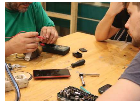
Εκδηλώσεις «Ας επισκευάσουμε μαζί!», Ζάγκρεμπ, Κροατία.

Εάν μπορείτε να βρείτε ειδικευμένους εθελοντές και κατάλληλο εξοπλισμό, οι εκδηλώσεις επισκευής δεν είναι μόνο εξαιρετικές για το περιβάλλον, αλλά και εξαιρετικά ικανοποιητικές για τους εθελοντές και τους συμμετέχοντες. participants alike.